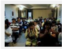
Latihan merasakan getaran kasar dan getaran halus